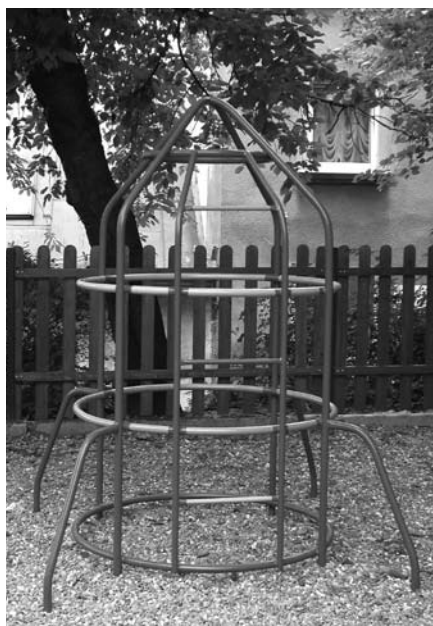
Przeplotnia w kształcie rakiety

Jednocześnie informujemy, że w ramach możliwości finansowych i w przypadku znalezienia w centrum Cieszyna odpowiednich miejsc na tego rodzaju place, umieścimy w planach kolejne inwestycje umożliwiające dzieciom spędzanie czasu w bezpiecznych miejscach rekreacyjnych.