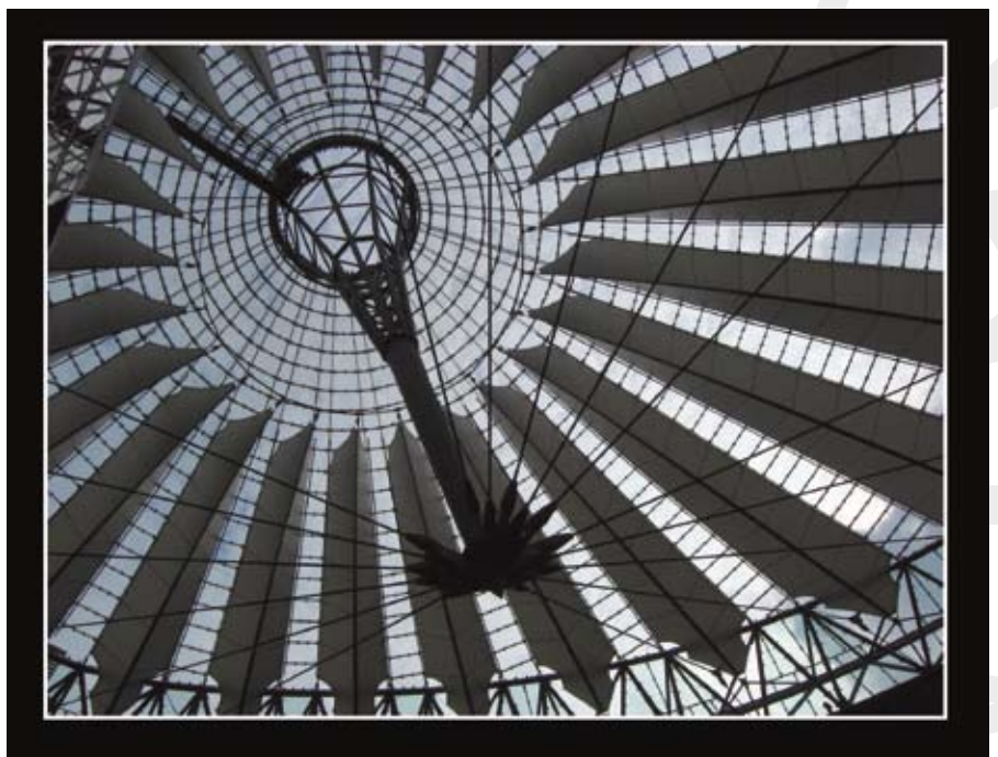
Fot. Agnieszka Chachłowska